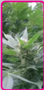
Special Kush #1