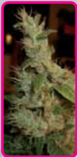
Shining Silver Haze