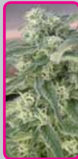
Special Queen #1